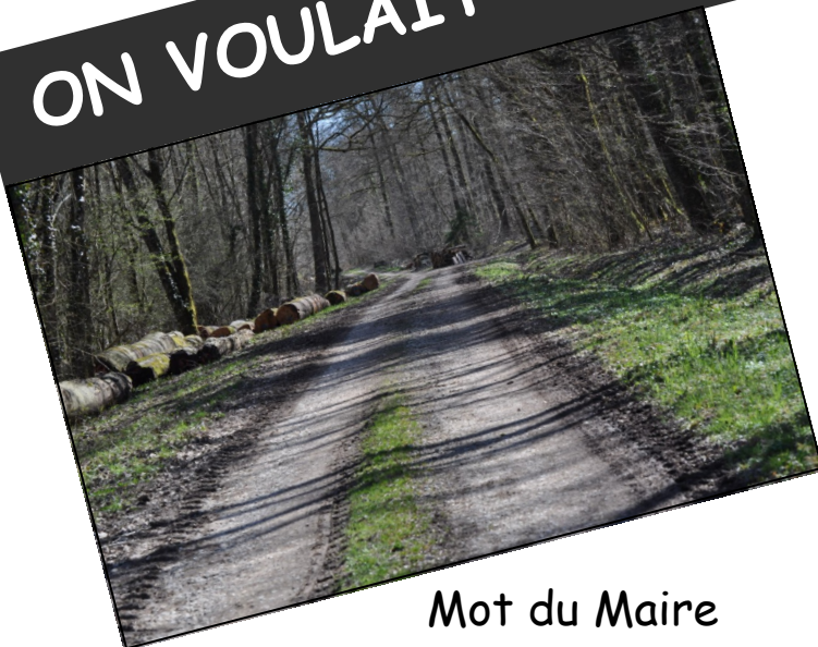
Mot du Maire